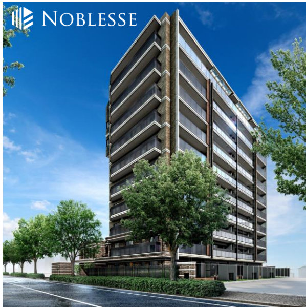
外観パース（完成イメージ）

当社は引き続き、免震マンションの供給等を通じて安全・安心な住まいづくりに取り組むとともに、「中期経営計画 2023」（5 月 12 日公表）に掲げる、マンション供給エリアにおける「免震マンション No.1」を推進してまいります。