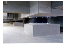
免震装置（参考画像）

免震構造とは、地盤と建物の間に設置した免震装置が大地震時の激しい揺れを吸収し軽減することで建物全体をゆっくりとした揺れにする構造です。一般的に地震の揺れは3分の1から5分の1に低減されます。