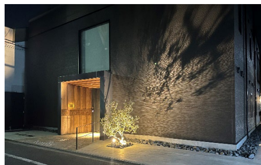
夜間にはライトアップされ、高級感のある佇まいとなる

コロナ禍における様々な制約の中、予定通りに建物を完成していただいたナイスさんに感謝いたします。