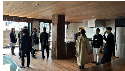
計42名が参加された完成見学会