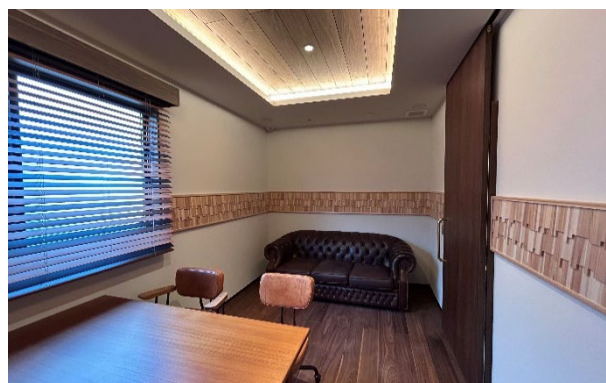
アクセントウォールが設置された相談室