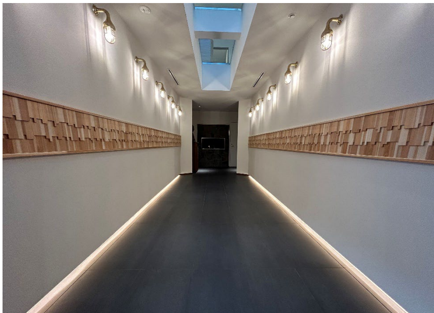
北山杉を用い、伝統技法である「鎧張り」をモチーフにデザインされたアクセントウォールが続くエントランスホール

当社グループでは引き続き、建築物の木造・木質化を推進するとともに、伝統ある北山杉の利用促進に努めてまいります。