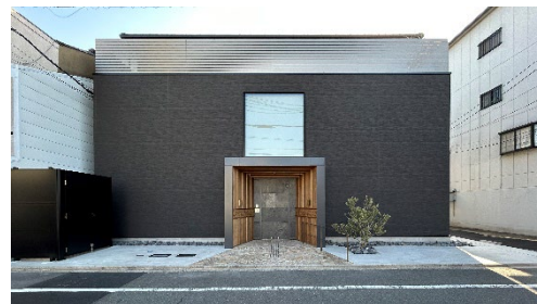
京都市の景観条例に沿った外観