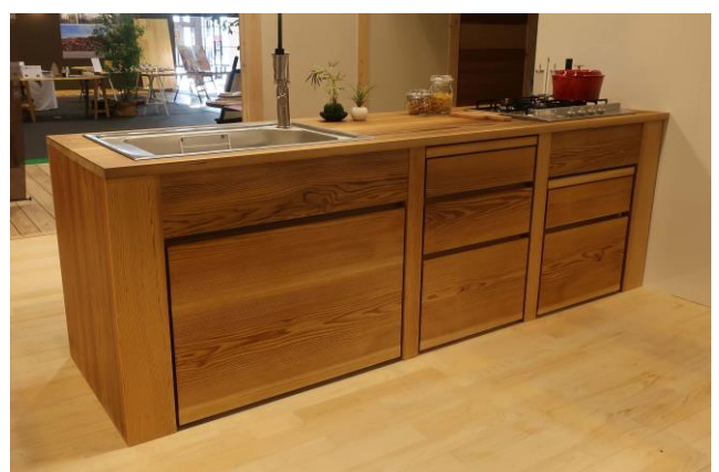
キッチン面材用無垢素材の販売【建築資材事業】