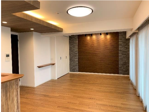
中古マンション リノベーション(専有部)【住宅事業】