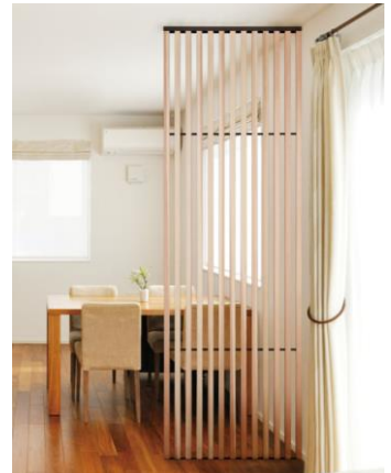
国産材を使ったインテリア商品の販売【建築資材事業】