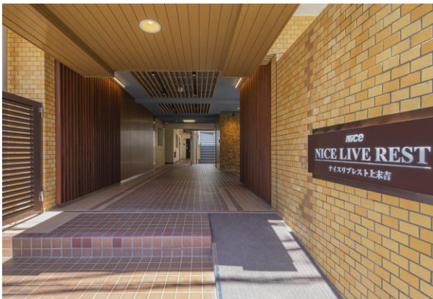
中古マンション リノベーション(共有部)【住宅事業】