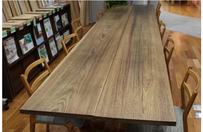
テーブル用の無垢素材の販売【建築資材事業】