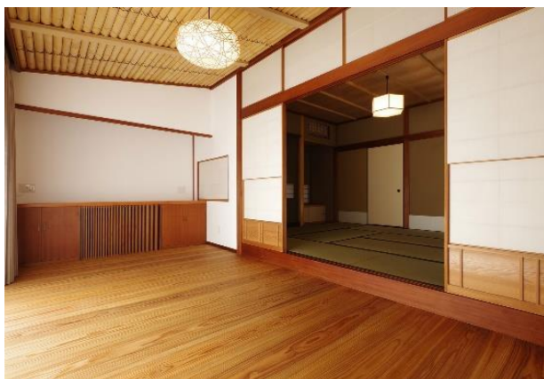
OB施主様 リノベーション【住宅事業】