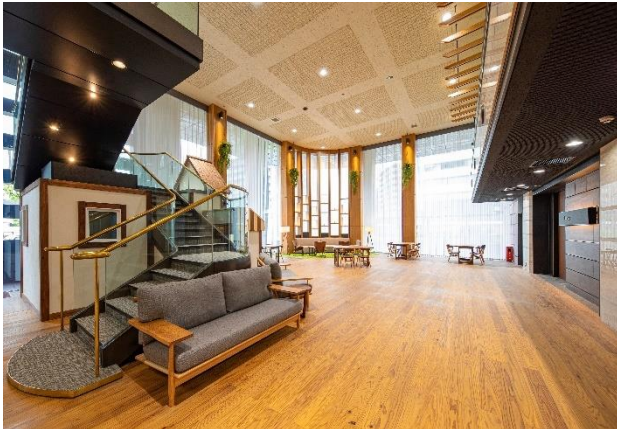
オフィスビル リノベーション