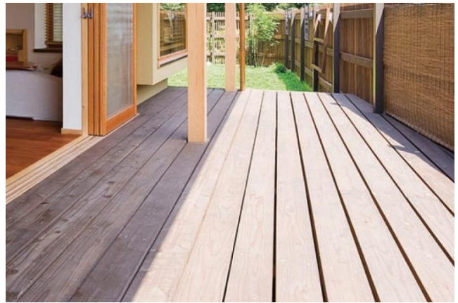
エクステリア商材の販売【建築資材事業】