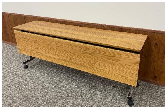
オフィス家具の木質化提案【建築資材事業】