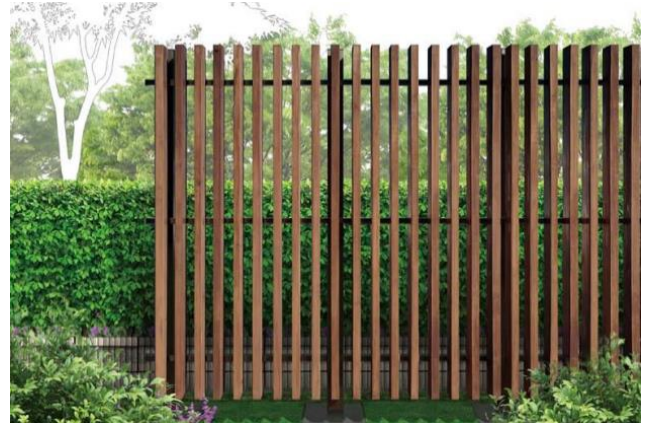
フェンス用素材の販売【建築資材事業】