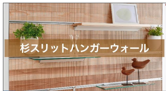
「ナイスグループのオリジナル商品」ブース 木材製品から太陽光発電システムなどの省エネ・創エネ関連商品まで、様々な商品をご紹介します。