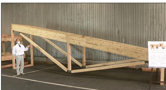
「木造建築」ブース 中・大規模木造で大空間を実現する各種工法について、実物大躯体を用いて特長をご説明します。(画像：張弦トラス)