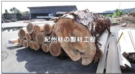
「ふるさと材」ブース 製材工程や職人の技など、各自治体が地域材の特長についてご紹介します。