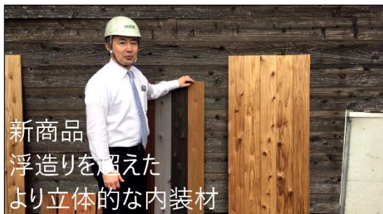
「木材市場大開放」ブース 全国で展開する各木材市場の担当者がお薦めの木材製品についてご説明します。(画像：ナイス(株)相模原市場)