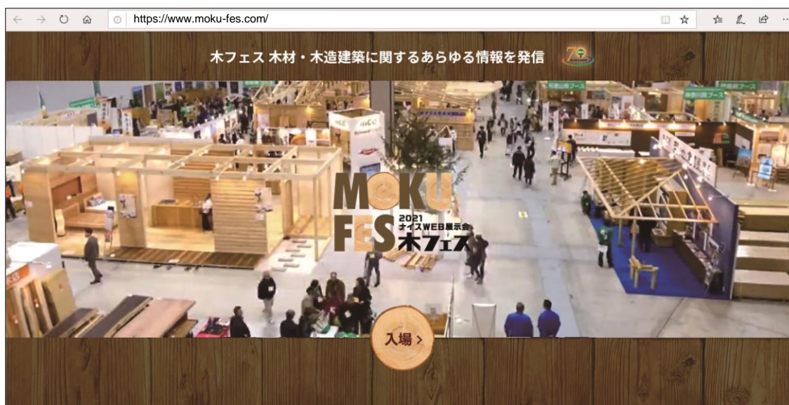
サイトトップ画面