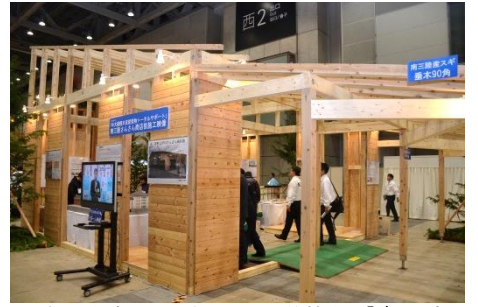
大きな軒・ひさしが特徴的な「南三陸さんさん商店街」の実物大構造躯体

そのほか、新素材として注目が高まるCLTについても、日本初となるCLTと鉄筋コンクリート造の平面混構造で宮城県多賀城市に建築したナイス(株)仙台事務所棟を紹介します。