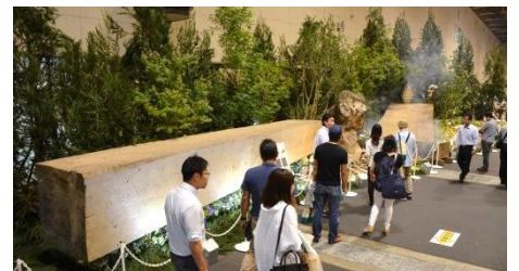
2,500年前の火山活動により地中に埋もれた推定樹齢1,500年の神代スギ

子どもの心身の発達に良いとされる「木育コーナー」では、木とふれ合っ遊ぶことで子どもの力を引き出す、優しい手ざわりの国産の木材を使ったおもちゃが勢ぞろいします。