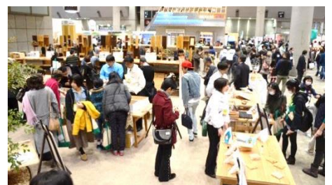
木の力を体験できる「木のソムリエコーナー」

暮らしへの具体的な木の取り入れ方について、キッチンや寝室など実際の生活をイメージした空間展示を行うほか、ウッドデッキなどのエクステリア空間や木製の家具などを展示し紹介します。