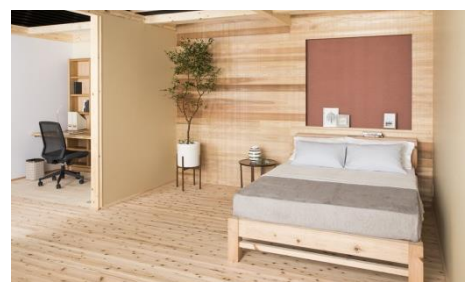
木のある暮らしを提案する空間展示