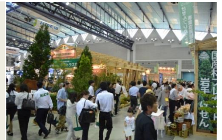
多くの来場者で賑わった昨年の会場

「木と住まいの大博覧会」は、構造材や内外装に木材を使った住宅をはじめ、中・大規模木造建築物から木製品、木育、学術研究まで、木に関する最新の製品・技術・情報をふんだんに紹介いたします。人を健やかで幸せにする木の力を五感で体感しながら、一般ユーザーからプロユーザーまで木について学び親しんでいただける木材総合展示会です。