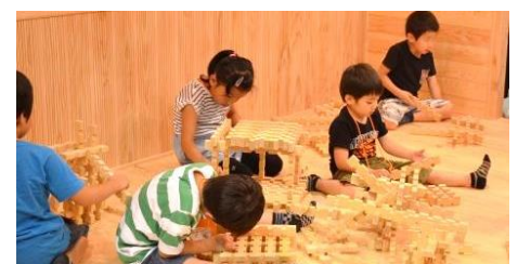
親子で木とふれ合える「木育コーナー」