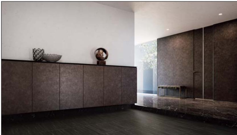
<室内ドア・収納・造作材の最上位シリーズ>

このほか、BCMの一環として物流改革を推し進めてまいります。昨年は埼玉県に草加物流センターを開業し、首都圏での物流ネットワークの拡充を図りました。本年は本社敷地内に新たな物流倉庫の建設を進め、また、二次元コードを活用したトレーサビリティを強化致します。これらの取り組みを推進し、不測の事態においてもメーカーとしての供給責任を果たしていきたいと考えております。